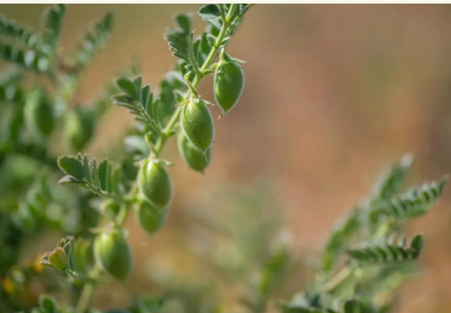
Για ρεβίθι Mesorhizobium ciceri