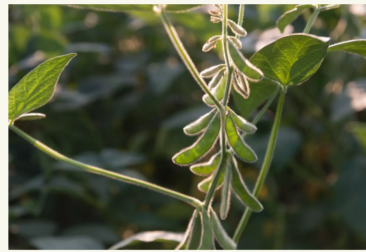
Για σόγια Bradyrhizobium japonicum