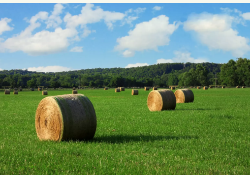
Για μηδική Sinorhizobium meliloti

Περιέχουν περισσότερο από 1,5 δισεκατομμύριο βακτήρια ανά γραμμάριο