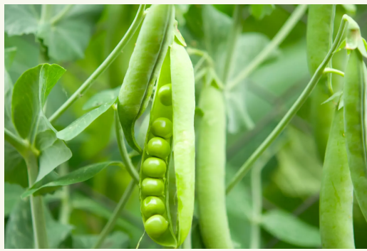
Για βίκο, αρακά, κουκιά Rhizobium leguminosarum