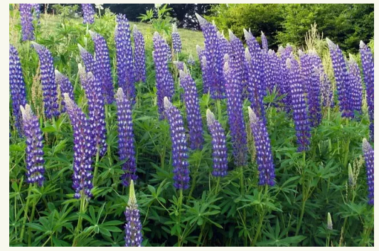
Για λούπινο Bradyrhizobium lupini